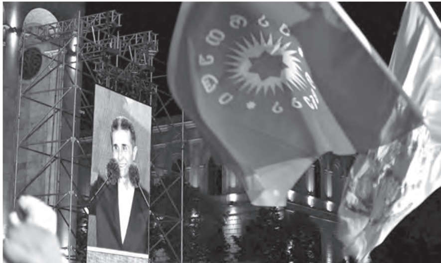
Б.Ивинашвили заңды қолдау митингісінде.

1 мамырда Грузияның Парламенті «Шетелдік ықпалдың ашықтығы» заңын екінші оқылымда қабылдады. Бұл құжат ақпараттық кеңістікте «шетелдік агент» туралы заң деген атаумен белгілі. Алда үшінші оқылым бар. Заң жобасының бастамашысы билеуші партия – «Грузиялық арман». Елдің Президенті Саломе Зурашвили Парламент заңды қабылдайтын болса, мемлекет басшысы ретінде «вето» қоямын деп мәлімдеген еді. Биыл билеуші партияның негізін қалаушы, әрі кешбасшысы Бидзина Ивинашвилидің ашық саясатқа оралуы мен осы заңды қабылдауға деген талпыныс арасында байланыс бары анық. Себебі, алда парламент сайлауы күтіп тұр.