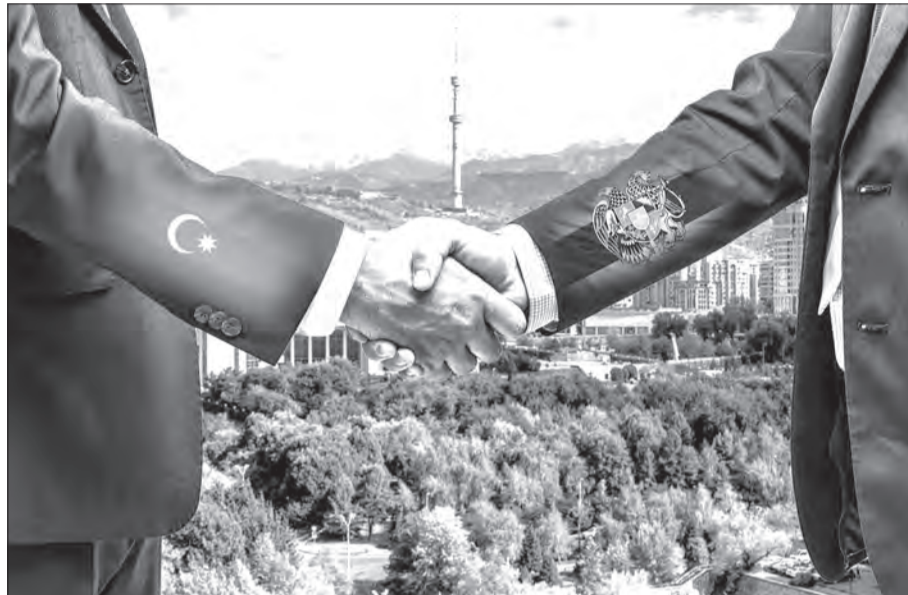
Коллажды жасаған Нұрболот Нұрболоттың ӨРІСҰЛЫ.

Естеріңізде болса, бұған дейін «АҚШАМ-АҚПАРАТ» хабарлағандай, Қазақстан Президенті биылғы сәуір айында Арменияға жасаған ресми сапары аясында, Оңтүстік Кавказ аймағындағы шиеленісті бейбіт шешуде Әзербайжан және Армения тарапы өкілдерін келіссөз жүргізуге, ара-