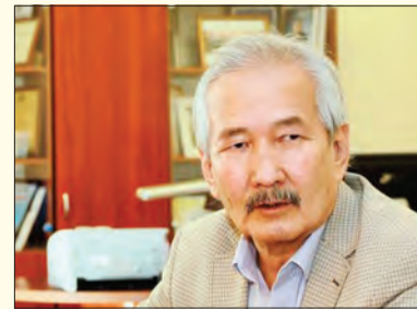
Смағұл ЕЛУБАЙ, Түркі дүниесі әдеби сыйлығының лауреаты, жазушы: