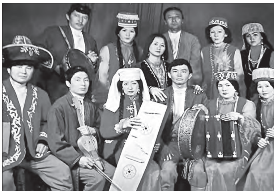
«Сазген» фольклорлық-этнографиялық ансамблі, 1981 жыл.

Музейдің алғашқы жасақталған экспозиция көрмесі 1981 жылдың 24 сәуірінде Панфилов көшесіндегі 99 нөмірлі бұрынғы көпес үйінде ашылды. Экспозицияның 5 залына 60-қа жуық музыкалық аспап қойылды. Өз заманында дауылпаз күйші, жезтаңдай әнші болған тұлғалардың ұстаған саз аспаптары жинақталып «Мемориал-ескерткіш мұралар» залы ашылды. Ұлы Абайдың, Біржанның, Сейтектің, Махамбеттің, Динаның, Жамбылдың домбыра-