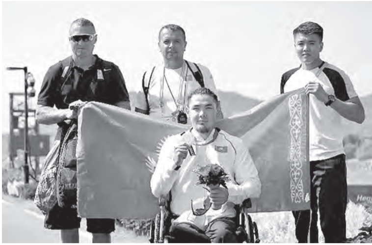
ПАРИЖ – 2024