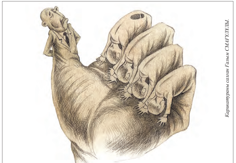
Карикатураны салған Ғалым СМАҒҰЛҰЛЫ.