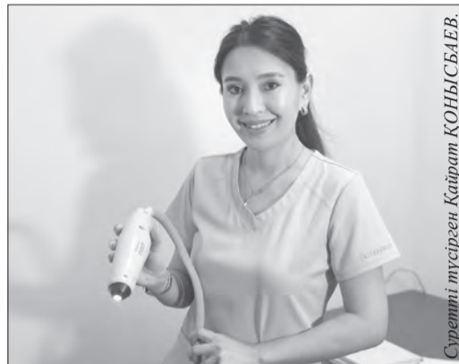
Суретті нұсқауға Қайрат ҚОНЫСБЕКОВ.

Алматының Перинатология және балалар кардиохирургиясы орталығына ретиналды камера орнатылды