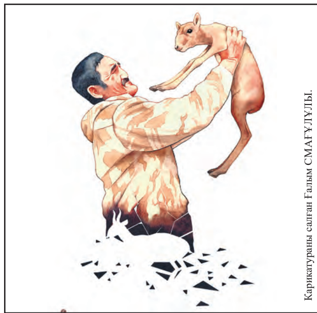
Карикатураны салған Ғалым СМАҒҰЛҰЛЫ.