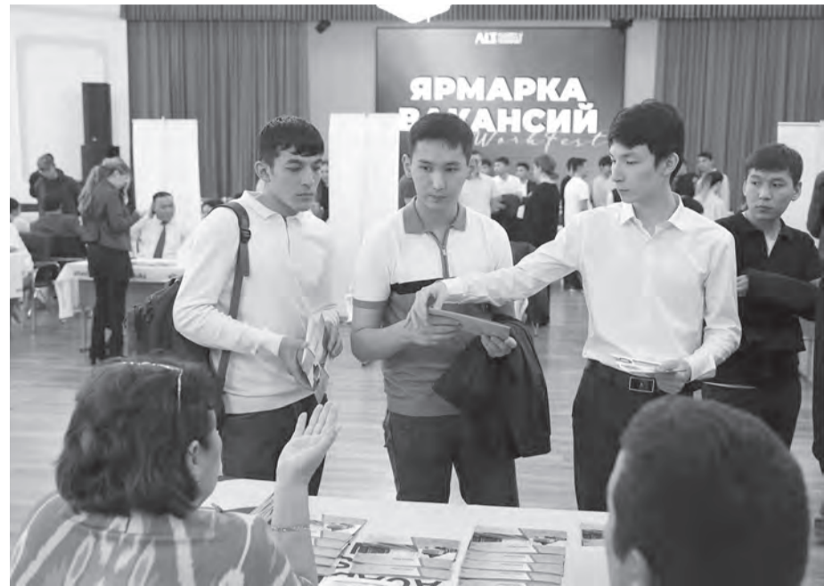
Суретті түсірген Қайрат ҚОНЫСБАЕВ.

– Біз жыл сайын ақпан айынан бастап қаламыздағы, өңірлердегі біраз компанияларға бос жұмыс орындары жәрмеңкесіне қатысуға ұсыныс айтып, хат жазамыз. Биыл біздің ұсынысымызға орай 40-қа тарта кәсіпорын кері байланысқа шығып, 100-ден астам бос жұмыс орындарын ұсынып отыр. Бұл жәрмеңкеге бітіруші түлектермен қоса жоғары курс студенттері де қатыса алады. Біздің білім беру бағыттарымызда инженерия және инженерлік іс, көліктік қызметтер көрсету, телекоммуникация, ақпараттық телекоммуникациялық технологиялар, сәулет және құрылыс секілді 6 сала бойынша түрлі