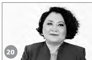
20 Жандай Сана